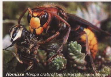
Hornisse ( Vespa crabro ) beim Verzehr einer Fliege

Wespen und Hornissen füttern ihre Brut ausschließlich mit Insekten. Ein Hornissenvolk fängt pro Tag so viele Insekten (Fliegen, Mücken, Motten usw.) wie fünf Meisenpärchen an ihre Jungen verfüttern. Ein Wespenvolk der Deutschen oder Gemeinen Wespe mit einer Volksstärke von über 10.000 Tieren braucht etwa die drei- bis vierfache Menge.