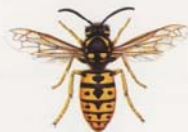
Deutsche Wespe (Paravespula germanica)