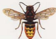
Mittlere Wespe (Dolichovespula media)