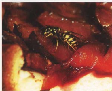
Wenn der Sonntagskuchen auf dem Gartentisch steht, können Deutsche und Gemeine Wespe lästig werden