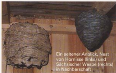
Ein seltener Anblick, Nest von Hornisse (links) und Sächsischer Wespe (rechts) in Nachbarschaft

Wespennester sind einjährig. Jedes Jahr wird ein neues Nest gebaut. Das alte Nest bleibt ungenutzt.