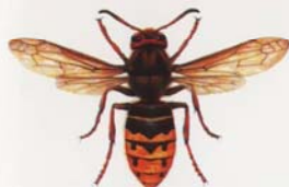
Hornisse (Vespa crabro)