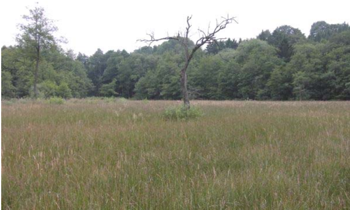
Die Kernzone des Naturschutzgebiets “Bucher Moor“

Besonders erwähnt seien hier die Tagfalter: Teufelsabbiß-Scheckenfalter ( Euphydryas aurinia ), Großes Wiesenvögelchen ( Coenonympha tullia ), Baldrian-Scheckenfalter ( Melitaea diamina ) und das Dunkelstirnige Flächtenbärchen ( Eilema luterella ).