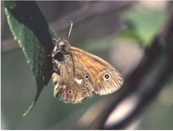
Großes Wiesenvögelchen ( Coenonympha tullia )