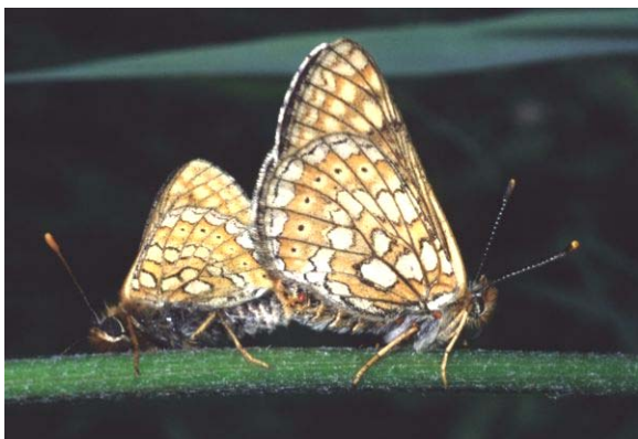
Teufelsabbiß-Scheckenfalter ( Euphydryas aurinia )