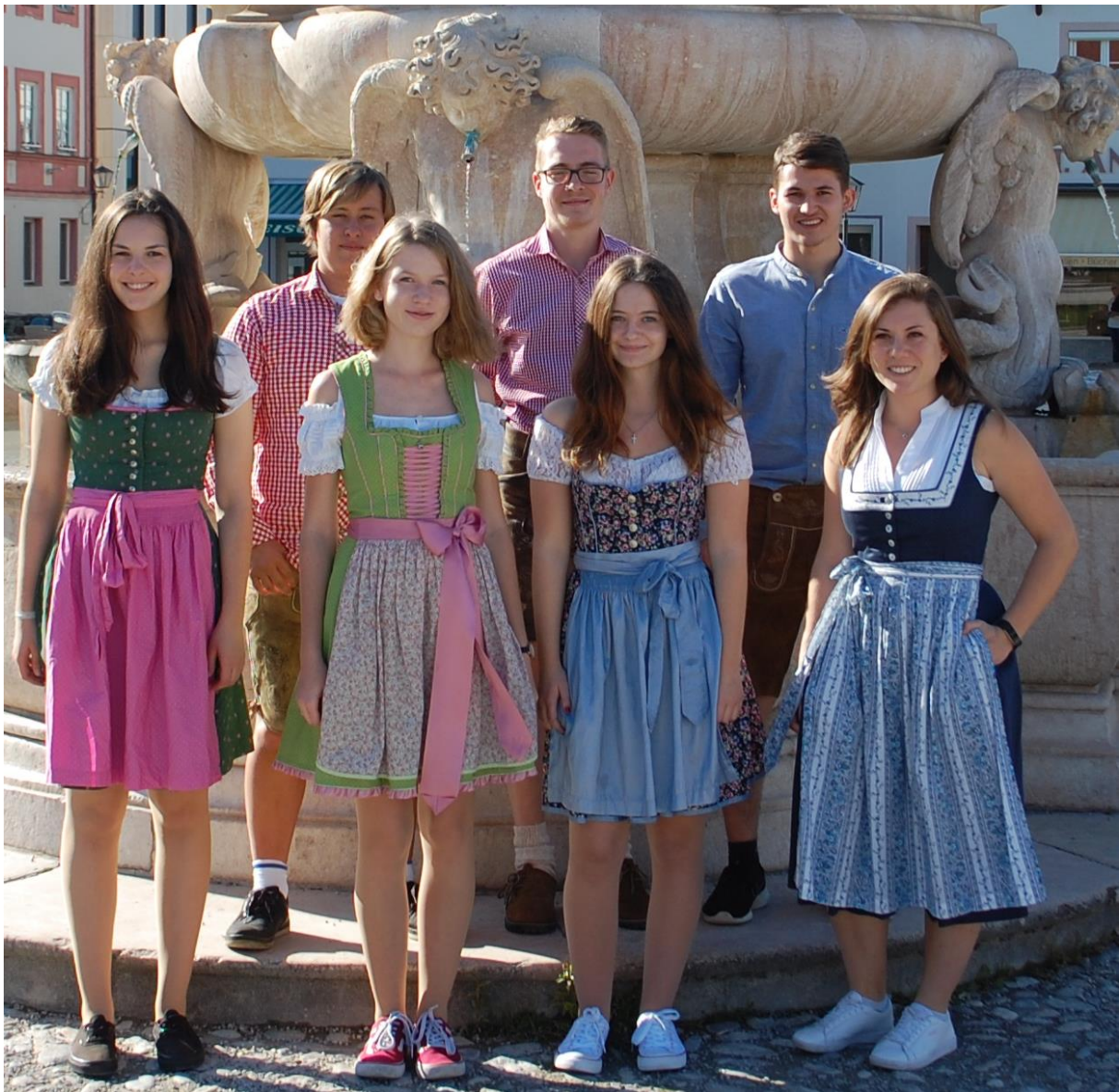
Bild: Auszubildende/Anwärter der Einstellungsjahrgänge 2016 bis 2018

Wir danken den verschiedenen Behörden (zum Beispiel dem Landratsamt Traunstein) und Institutionen für die Mithilfe bei der Erstellung dieser Information.